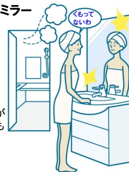
※3面鏡はセンターミラーのみ、2面鏡はメインミラーのみ。

電気代ゼロで、全面クリア。新感覚のミラーです。鏡の表面に、吸水性・親水性のある膜をコーティング。狭い部分しか効果のなかった従来品(ヒーター)に対し、全面がくもりにくいため、お風呂上がりも鏡はいつもクリア。電気代もかからないので経済的です。