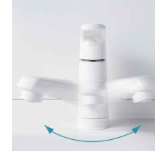
汚れがとれやすく、お手入れしやすい素材。吐水部を左右に首振りできます。