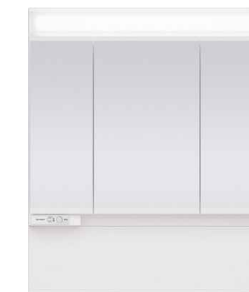
スタンダードLED3面鏡 ミドルパネル