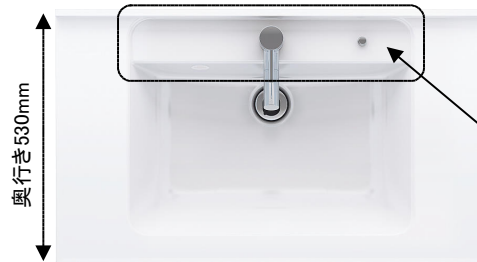
(画像は幅900mm) ●ボール深さ:165mm 容量:12L