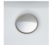
掃除ににくいフチの隙間がない排水口。