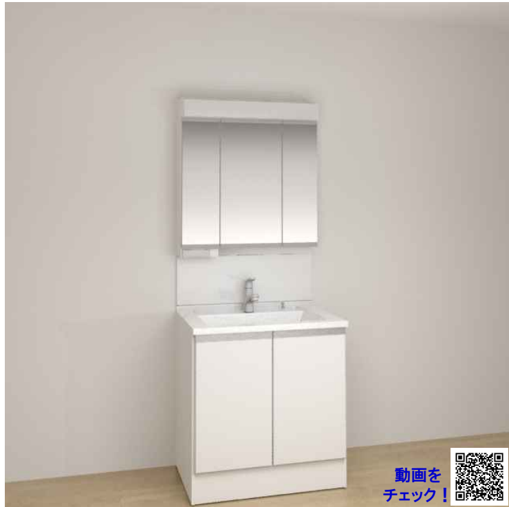
※画像はイメージです。組合せなどはお見積書をご確認ください。