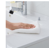
水に濡れた物を置くのに便利なウェットエリア。継ぎ目や隙間がなく、汚れてもささっと拭くだけ。