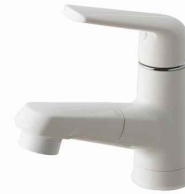
マルチシングルレバーシャワー (スゴビカタイプ) ※シャワーヘッドは引き出せます。