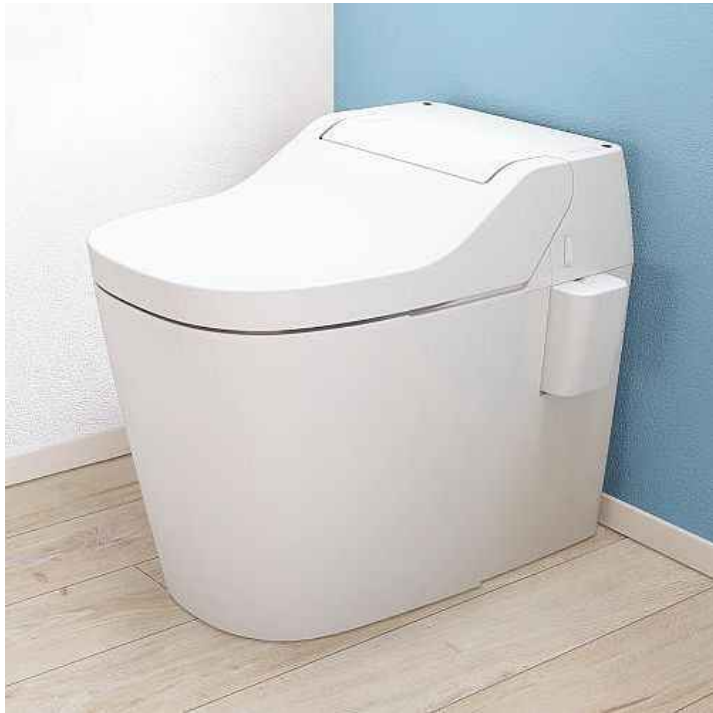
※画像はイメージです。組合せなどはお見積書をご確認ください。 小物は付属しておりません。