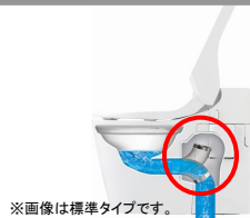
※画像は標準タイプです。

少ない水で一気に流すので、節水ができ、しかも静か。 1回あたりの洗浄水量5.7L。(大洗浄時の場合)